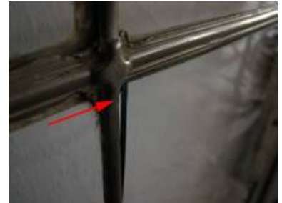
Deutlich sieht man, welche Belastung die normalen Floatglasscheiben für das originale Bleinetz bedeuten.