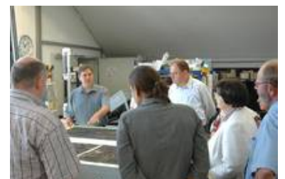
Auch bei diesem Bauvorhaben wurden