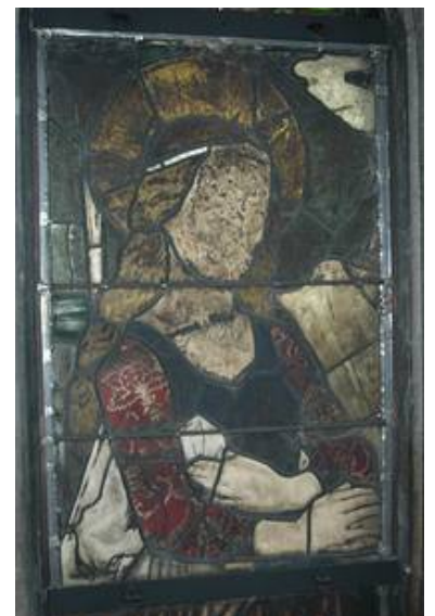
Das Glasmalereifeld NII 7b aus dem mittelalterlichen Bestande im Vorzustand in situ