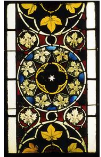
Das Feld 6a aus dem Fenster in Stadtprozelten zeigt die Verwandtschaft der Werkstätte(n).