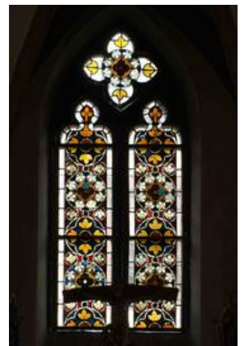
Das Fenster im Nachzustand von Innen