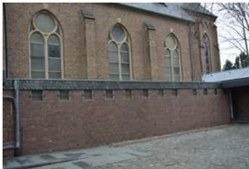
Die Südfassade im Vorzustand mit den Acrylglasscheiben