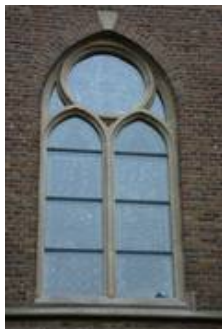
nVII im Nachzustand, auch durch die Schutzscheiben sieht man den Glasmalereischatz