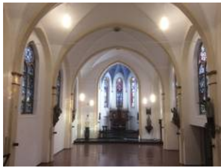
Blick ins Kirchenschiff, nach Osten, NZ