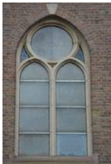
nVII im Vorzustand, die Glasmalereien sind durch die Acrylglasscheiben nicht zu erkennen