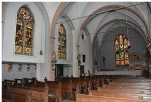
Blick ins Kirchenschiff, nach Westen, VZ

Die Werkstätte in der die Glasmalereien ursprünglich gefertigt wurde ist leider nicht bekannt, auch da die Scheiben nicht signiert wurden. Der Malstil gibt jedoch Anlaß zur Vermutung, dass die Scheiben aus dem Atelier Clayton & Bell stammen könnten, die ab den 1870ern bis ins 20. Jahrhundert Glasmalereien fertigten.