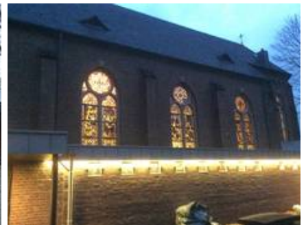
Gerade Nachts bei Beleuchtung setzen die Glasmalereien jetzt ein besonderes Zeichen