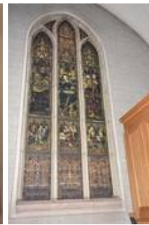
wI im Vorzustand