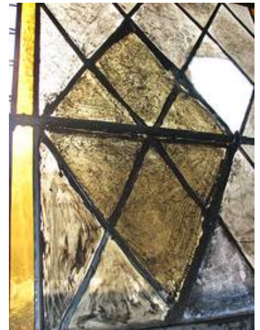
Teile der Gläser waren mit Kaltmalfarben nachträglich abgedunkelt