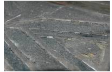
Extreme Verschmutzungen über Teile der Fenster