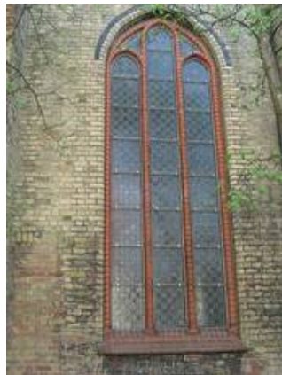
NVII im Nachzustand, die Edelstahlgitter fallen kaum auf und sind, gerade wenn man an die Vandalismusprobleme denkt, mehr als hinnehmbar