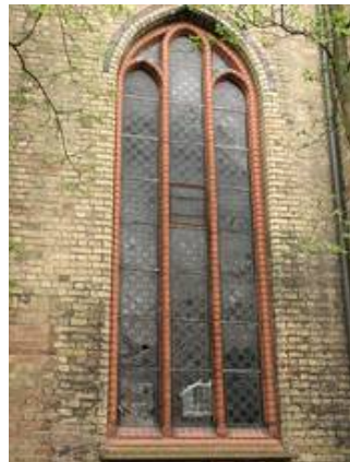
NVII im Vorzustand, deutlich erkennt man einige provisorische Sicherungsmaßnahmen; die mehr als deutlich die Probleme des Vandalismus zeigen