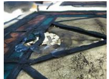
Neben der Verschmutzung wurden viele provisorische Reparaturversuche sowie ein geschundenes Bleinetz gefunden