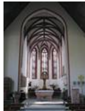
Nachzustand des Innenraumes