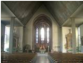
Vorzustand des Innenraumes vor den Arbeiten 2007/2008