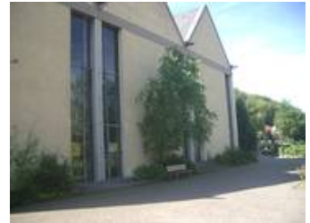
Ein Fassadendetail der Kirche im Vorzustand