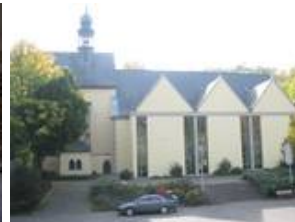
Aussenansicht im Nachzustand