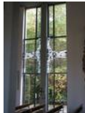
Ein Fenster im Nachzustand