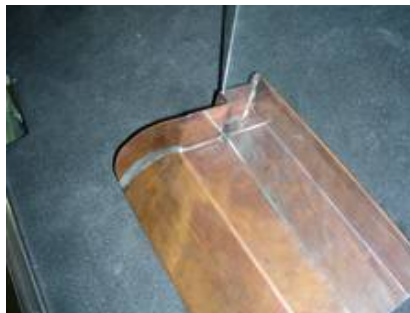
Abbildung einer Schwitzwasserrinne aus Kupfer an der die exakte Anpassung an das Mauerwerk gut zu erkennen ist.