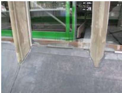
Abbildung einer Schwitzwasserrinne aus Kupfer und einer Bleischürze mit Ablauf nach außen auf eine mit Bleiblech verkleidete Sohlbank.