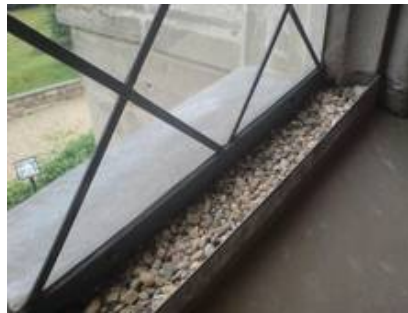
Abbildung einer Kondensatsammelrinne als Verdunstungsrinne an einem geografisch besonders exponierten Bauwerk bei dem auf jeden Fall die Gefahr bestanden hätte, dass durch den Winddruck Wasser in den Innenraum gedrückt wird.