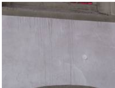
Ablaufspuren unter einem Kirchenfenster

Ein weiterer wichtiger und oft, gerade aus gestalterischen Gründen bewußt vernachlässigter Punkt ist, eine ausreichend hohe und in der Körnung richtige Kiesschüttung.