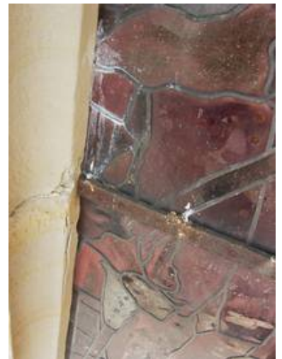
Auch der zunehmende Rostdruck durch die Eisen und die Schäden am Sandstein machten einen Ausbau der Glasmalereien dringend nötig

Dadurch sind die schutzverglasten Scheiben „bewegt“ und passen besser zu diesem historischen Gebäude als blanke und glatte normale Scheiben wie man sie z.B. in Schaufenstern einsetzt.