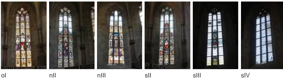
ol nll nlll sll slll slV