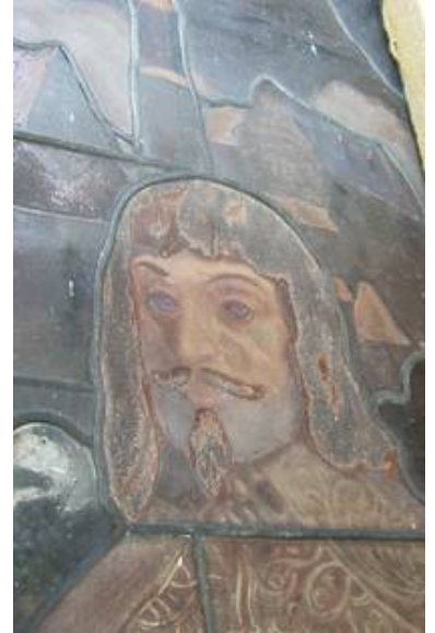
Diese Aufnahme der Malschichten läßt die Bedeutung einer Außenschutzverglasung nach dem derzeitigem Stand der Technik erahnen