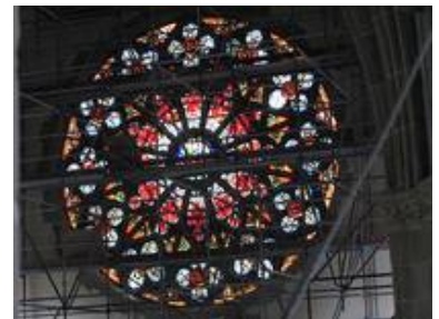
Die Gerüststockwerke verdeutlichen die Mächtigkeit der Südrossette

Die Christuskirche wurde im Verlauf des 2. Weltkrieges, in der Bombennacht vom 2./3. September 1942 beim Großangriff auf Karlsruhe und vom 4./5. Dezember 1944 bei einem erneuten Luftangriff schwer beschädigt. Hierbei kam es neben großen Schäden an Fenstern und Gewölben zu Schäden an der Rosette des Fronteingangs. Sofort nach Ende des Krieges begann man mit dem Wiederaufbau der Kirche. 1984 wurde der Wiederaufbau des ursprünglichen Turmhelms beschlossen, im September 1985 war dies dann realisiert.