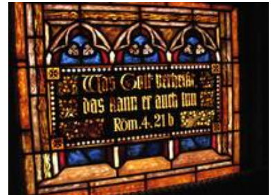
Noch in der Durchsicht zeigten einige Felder wenig von ihren Schäden