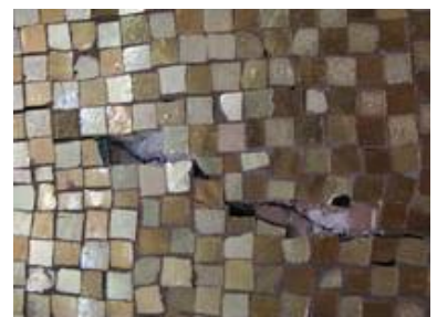
Risse im Mauerwerk führten zu einer Beschädigung des Mosaiks und zu einem Abplatzen der ca. 6x6mm aus blau-grünem Grundglas mit aufgelegtem Blattgold und überschmolzenem Deckglas gefertigten Steinchen