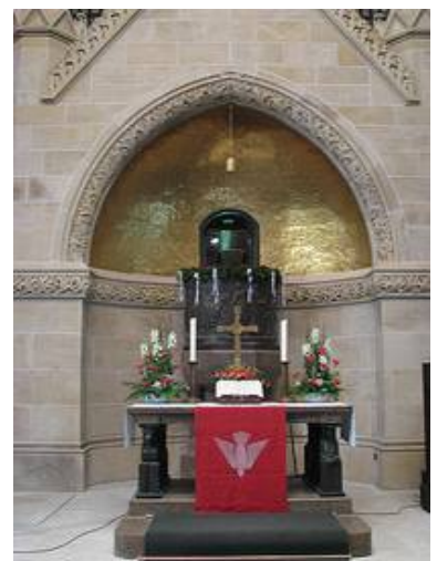
Die Altarapsis ist halbrund gewölbt und vollständig mit Goldmosaik ausgekleidet