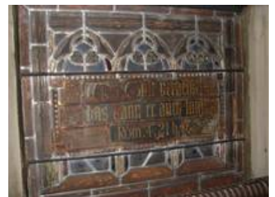
Im Auflicht jedoch wurden massive Probleme mit großflächiger Kaltmalerei deutlich

Zur Abstimmung der Maßnahmen fanden zahlreiche Besprechungen mit dem Bauherrn, dem Planer und dem Landesdenkmalamt statt.