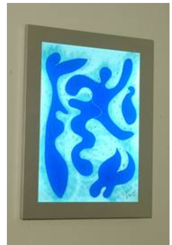
Auch die Lichtbilder in Fusingtechnik von Peter Peppel eignen sich zur individuellen Gestaltung von Räumen ohne Fenster, hier das Motiv Blues