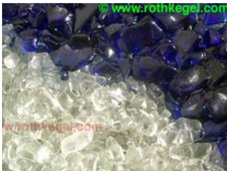
Verschmolzener Glaskies im Detail