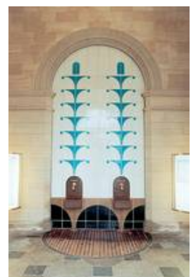
Wandelhalle Bad Kissingen Glasfliesen nach dem Entwurf von Florian Leitl