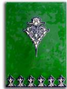
Glaskachel mit Blattgoldeinschmelzung und klassischen arabischen Ornamenten