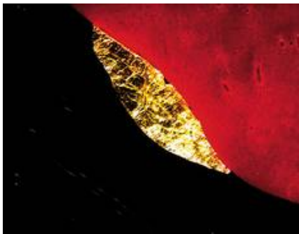
Detailaufnahme einer Blattgoldeinschmelzung