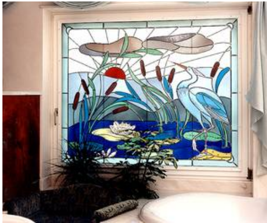
Ein weiteres Beispiel eines etwas anderen Sichtschutzes in einem Badezimmer, hier als Bleiverglasung mit Glasmalerei, Entwurf und Glasmalerei von Curd Lessig

Lassen Sie sich inspirieren auch Ihre Fenster zu gestalten!