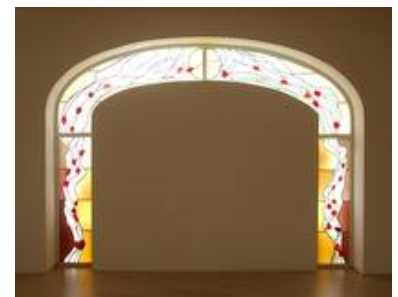
Eine ungewöhnliche Fensterform,

Statt gewöhnlichem Ornamentglas wurde in diesem Badezimmerfenster eine Schmelzglasscheibe (Fusingscheibe) mit abgeformten Muscheln und Seesternen eingesetzt.